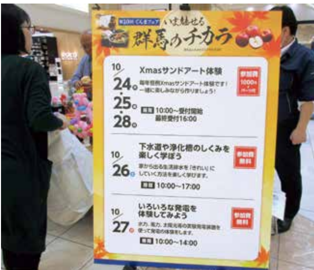
ぐんまフェアは10月24日～27日開催

10月26日（土）、太田市のイオンモールで開催された『第10回 ぐんまフェア』に参加しました。浄化槽協会はバルーンアートを配布し、県下水環境課職員が浄化槽クイズを実施するとともに、浄化槽ミニカットモデルとパネルにより、浄化槽に関する啓発を図りました。