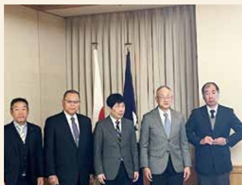
新春の知事表敬（令和7年1月9日）

終わりに、皆様のご健勝とご多幸をご祈念申し上げ、新年のご挨拶とさせていただきます。