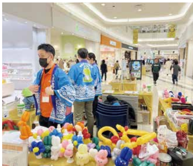
準備中の県下水環境課の皆さん