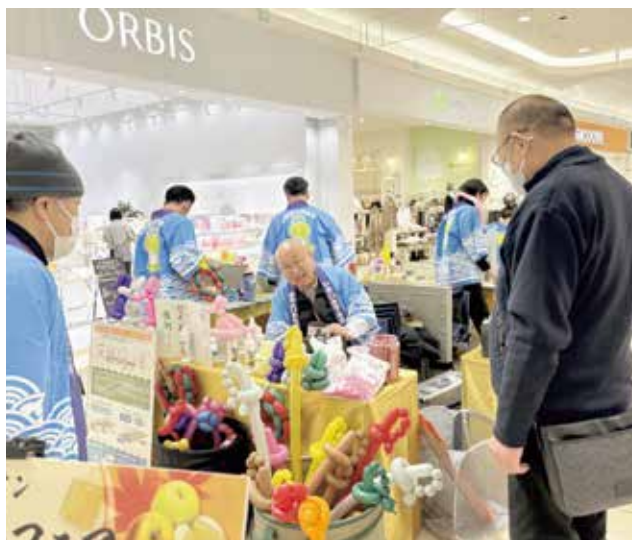
ぐんまフェアは11月14日～16日開催

11月15日（土）、高崎市のイオンモールで開催された『第11回ぐんまフェア』に参加しました。浄化槽協会はバルーンアートを配布し、県下水環境課職員が浄化槽クイズを実施するとともに、浄化槽ミニカットモデルとパネルにより、浄化槽に関する啓発を図りました。