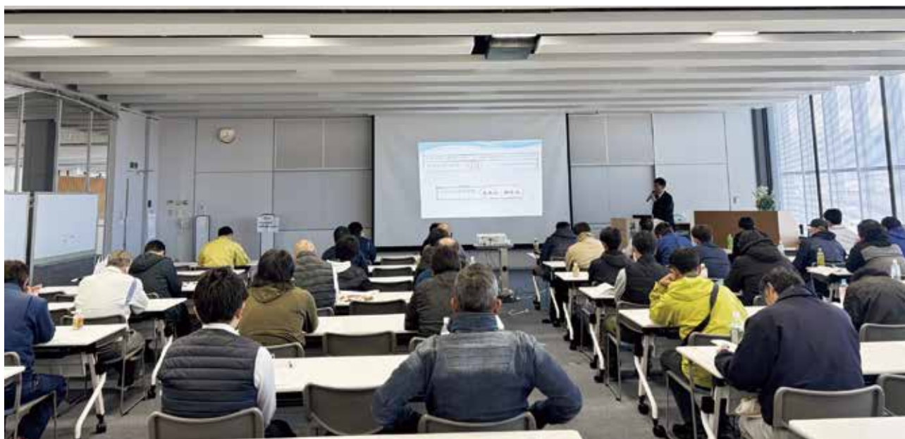
環境検査事業団職員による採水員業務の講義

指定採水員は、群馬県が指定した検査機関の検査員に代わって浄化槽の採水業務を行うことが出来る制度であり、検査の効率化を高め、法定検査の受検率向上に寄与するものであります。