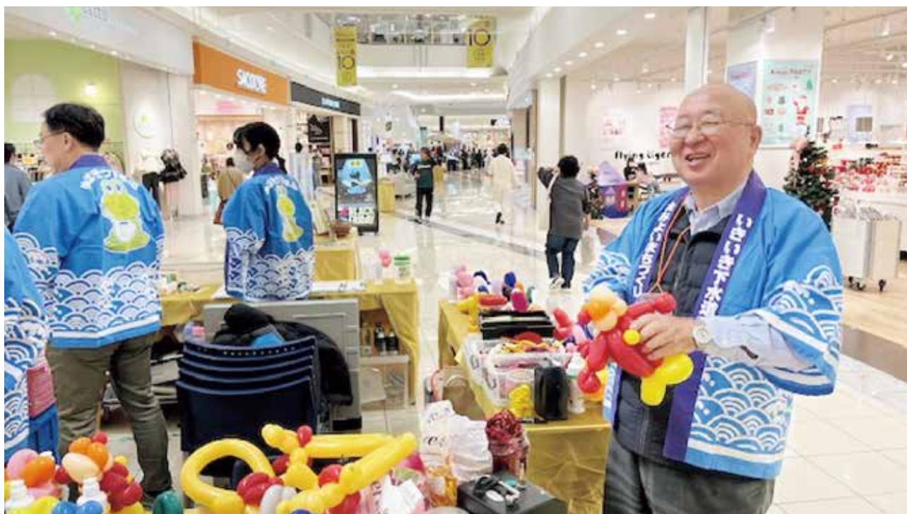
バルーンアートを創る林副会長