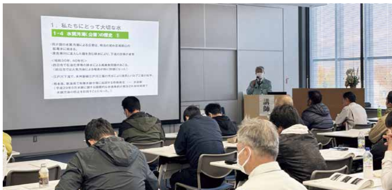
計量協会環境分科会講師による試料の採水についての講義